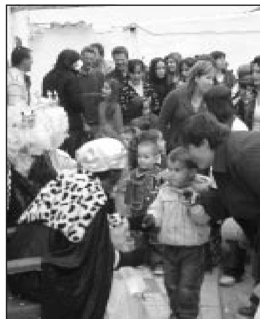
Reparto de regalos en Silillos.