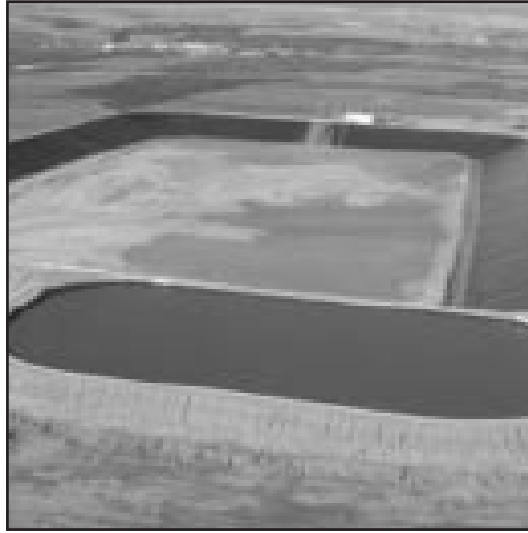
Balsa de la Comunidad de Regantes «Salva García».