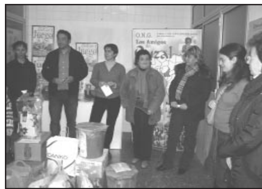
Momento de la entrega del material escolar en nuestra sede y los más de 80 kg enviados.

Por ello, optamos por emplear recursos humanos, tiempo y todos los medios que están a nuestro alcance para sensibilizar desde los más pequeños hasta los mayores. Con unos trabajamos en la Educación formal, gracias a que los directores de los Centros Educativos, nos permiten hacerlo en las clases, para que nuestros alumnos/as puedan adquirir hábitos de consumo responsable y sostenible, comprendan que la solidaridad