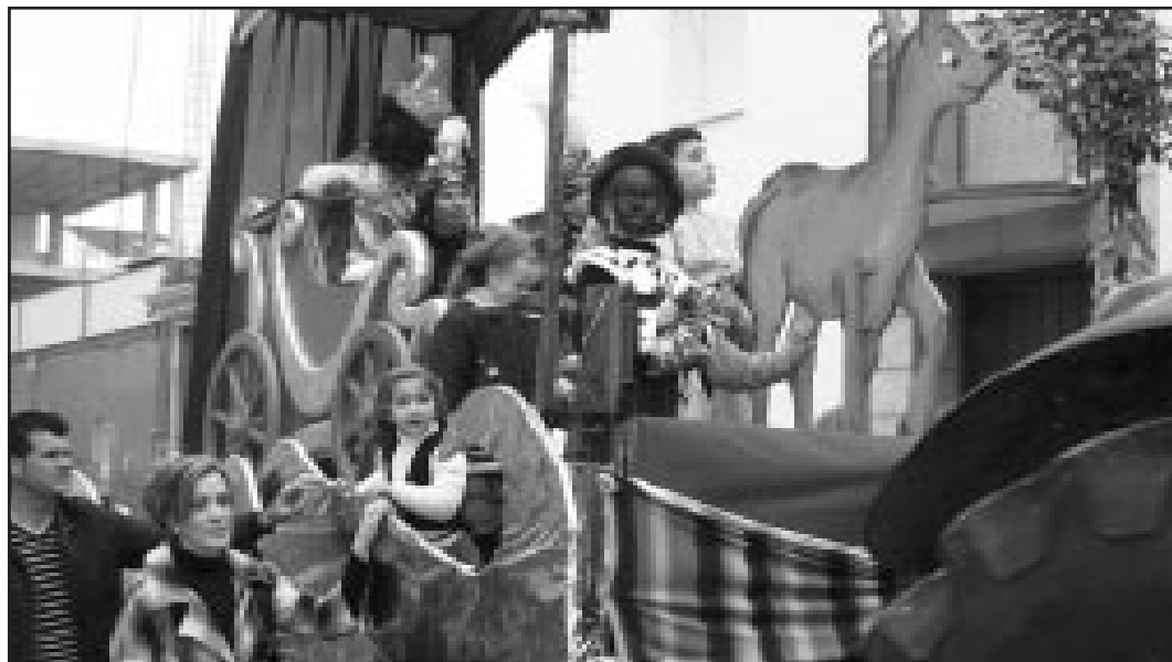
Cabalgata de Fuente Palmera.